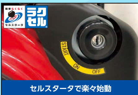
セルスタータで楽々始動