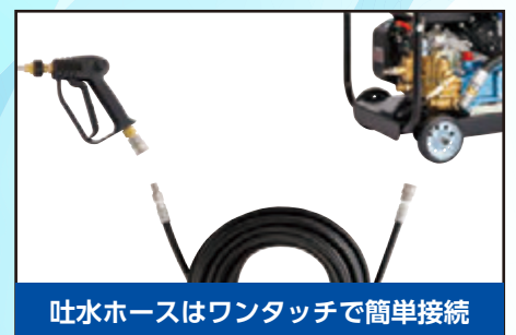
吐水ホースはワンタッチで簡単接続