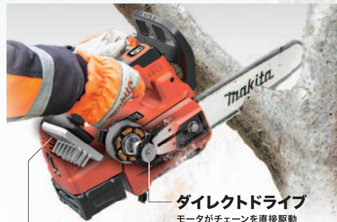
ダイレクトドライブ モータがチェーンを直接駆動 高速ハイパワーで切断可能。

(モータ部:3.2kg: バッテリBL4025含む。ガイドバー、チェーン刃、チェーンオイル含まず)