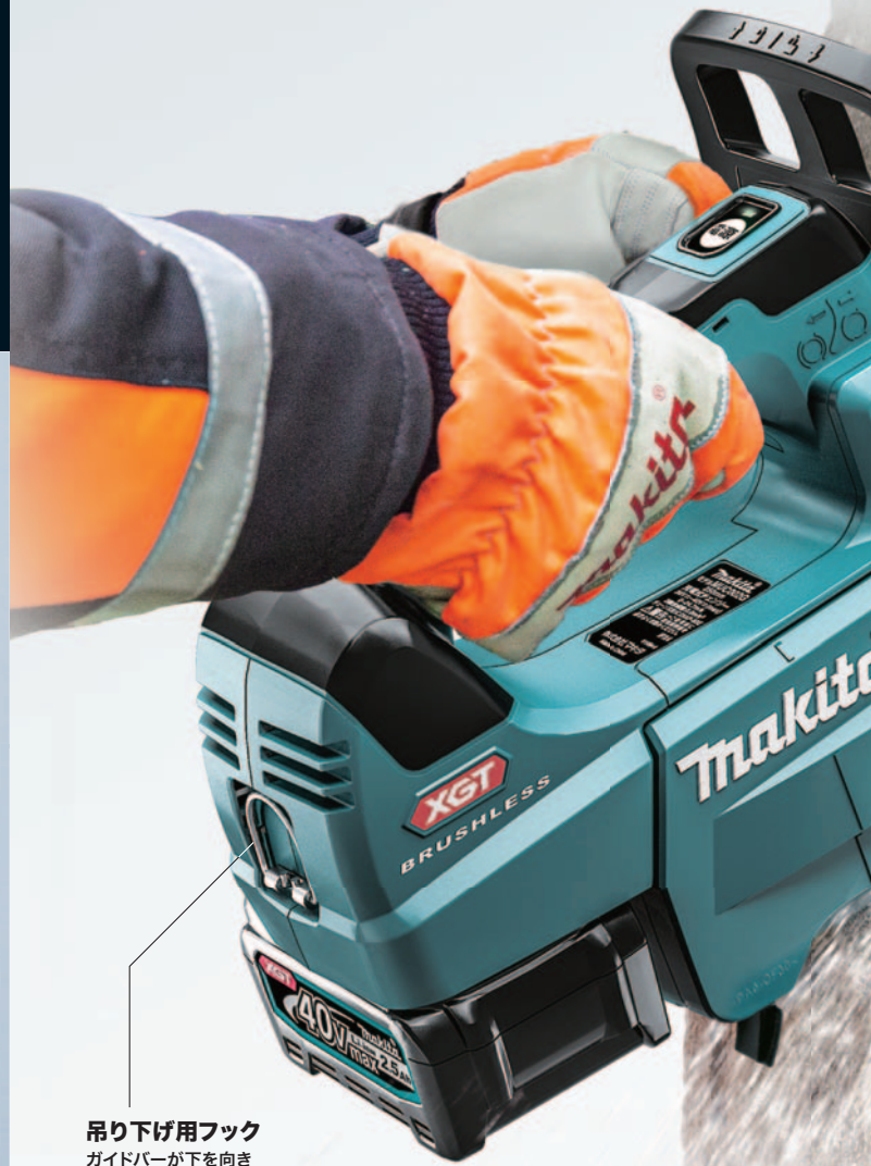
吊り下げ用フック ガイドバーが下を向き スムーズに吊り下げ可能